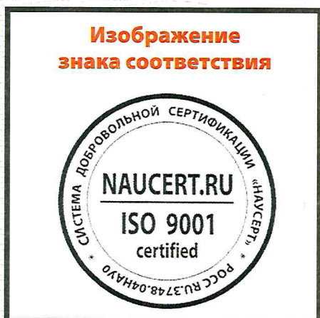
Изображение знака соответствия

Настоящим Разрешением Орган по сертификации разрешает держателю сертификата применять следующий Знак соответствия: